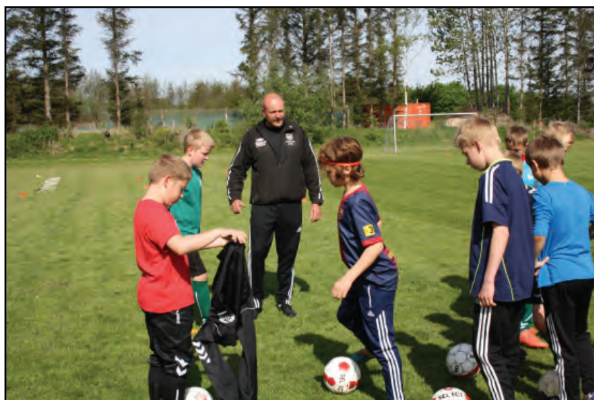
ZYD i gang med at træne