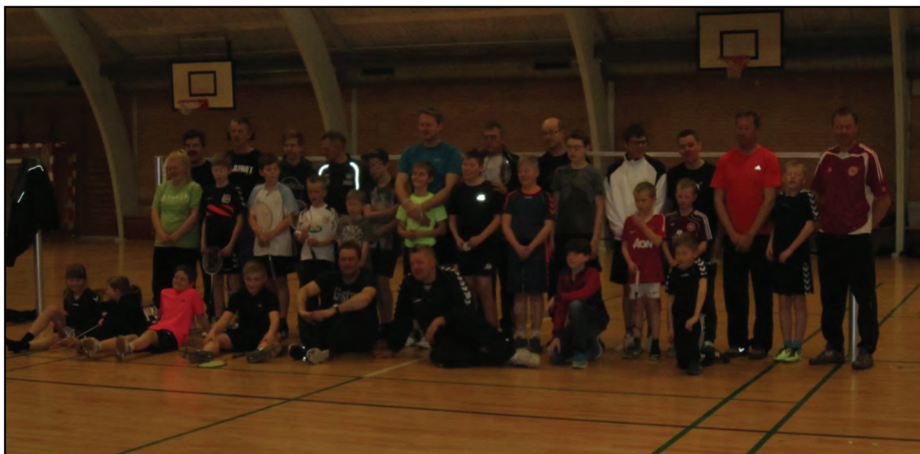
Familiestævne 1. april 2013.

ole.sorensen@nypost.dk Bjergby-Mygdal IF Badminton