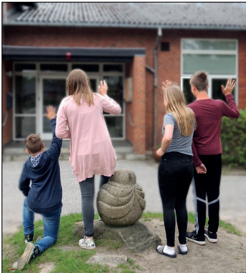
Farvel og tak til Bjergby-Mygdal Skole